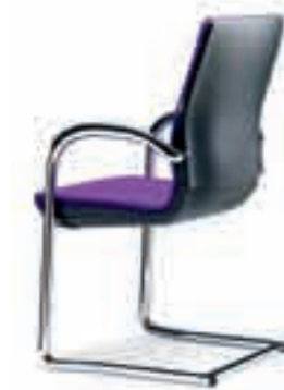
Armleggers vast Rugkap kunststof