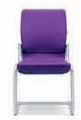
Armleggers geen Niet stapelbaar