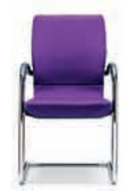
Armleggers vast Niet stapelbaar