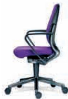
Rugbeugel gelakt aluminium Onderstel gelakt aluminium