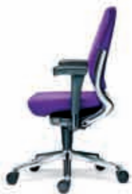
Rugbeugel gepolijst aluminium Onderstel gepolijst aluminium