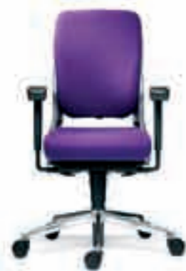
Armleggers verstelbaar HBDD