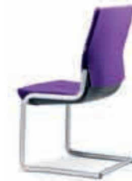
Armleggers geen Rugkap omgestoffeerd