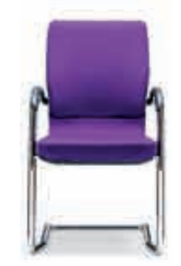
Armleggers vast Stapelbaar