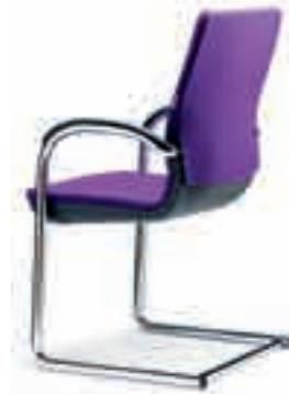
Armleggers vast Rugkap omgestoffeerd