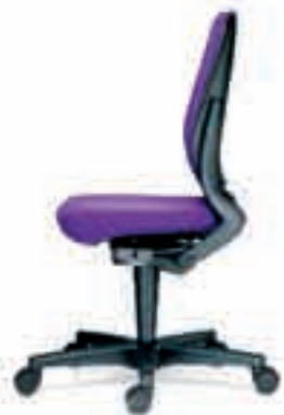
Rugbeugel kunststof Onderstel kunststof