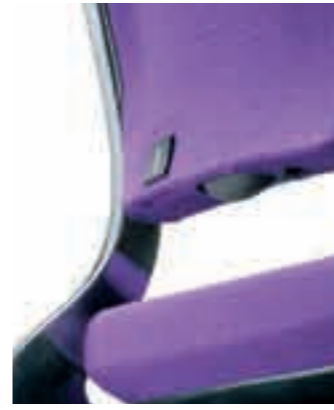
De lendesteun is middels een balg opblaasbaar.