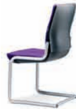
Armleggers geen Rugkap kunststof