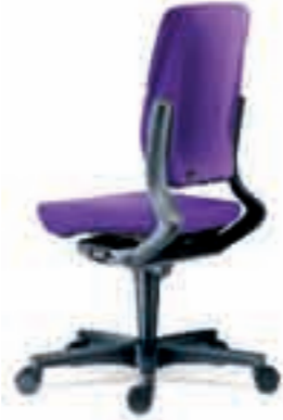
Rug extra hoog Rugkap omgestoffeerd