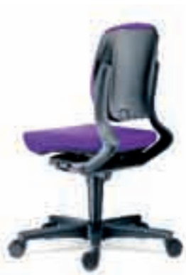
Rug hoog Rugkap kunststof

De stoel is modulair opgebouwd. Dus voor elke functie, voor iedereen, is een passende stoel samen te stellen. Met één type stoel kan het hele kantoor worden ingericht. Daarnaast beschikt Ahrend over een uitgebreid assortiment materialen, lakken en stoffen. Zorgvuldig op elkaar afgestemd, zodat alle Ahrend meubelprogramma's moeiteloos met elkaar kunnen worden gecombineerd.