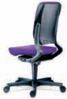
Rug extra hoog Rugkap kunststof